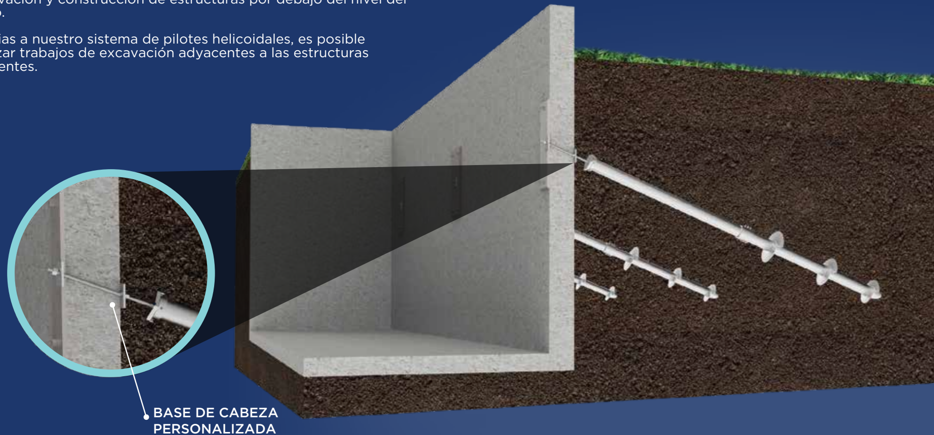
BASE DE CABEZA PERSONALIZADA

Gracias a nuestro sistema de pilotes helicoidales, es posible realizar trabajos de excavación adyacentes a las estructuras existentes.